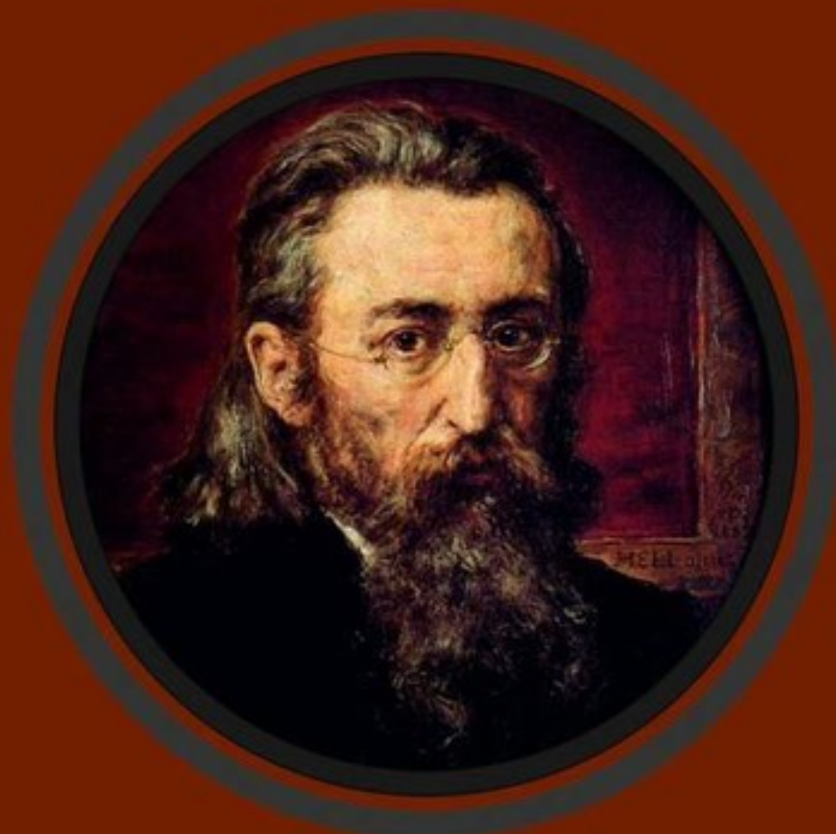
JAN ALOJZY MATEJKO 24.06.1838 - 01.11.1893

Ministerul Culturii al Republicii Moldova, Ambasada Republicii Polone în Chișinău, Zen Club Moldova, Sala cu Orgă, Agenția Relații Interetnice, Academia de Muzică, Teatru și Arte Plastice, Colegiul de Arte Plastice "Alexandru Plămădeală"